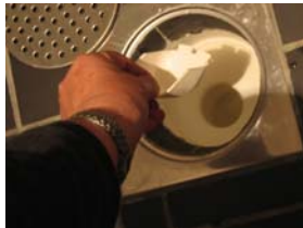
Lyft upp den lilla skopan.