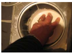
Det kan vara lite trögt att få låset på plats igen. Tryck till så tätningarna kommer på plats.