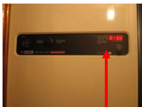
Hitta extra varmvatten uppe på frontpanelen

Om ni är många som bor i bostaden kan man be värmepannan om att höja temperaturen på varmvattnet så att det räcker till fler. Ett tryck på knappen ger förhöjning under 24 timmar och permanent ökning får man med två tryckningar. Läs mer i lägenhetspärmen under flik 12 sidan 4 och 5.