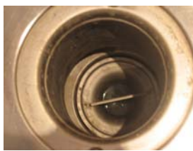
Gör rent och sätt tillbaka vattenlåset. Det kan vara lite trögt att få det på plats.