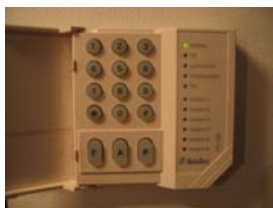
Här trycker du in din kod för att avbryta larmet. Det utlöses lätt vid os från ugnen