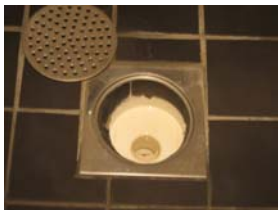
Lyft av det rostfria gallret.

Den brunn för avrinning som finns under pannan i teknikrummet står genom ett rör i förbindelse med avloppsbrunnen i duschen. Därför är det mycket viktigt att brunnen och vattenlåset i duschen hålls ren. Skulle det bli stopp i duschbrunnen, kan följden bli att vatten går bakvägen i röret in till teknikrummet och ut på golvet där, vilket i värsta fall kan orsaka fuktskador på omgivande golv och väggar.