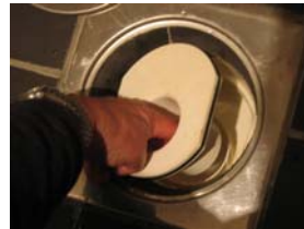
Stoppa ner fingrarna i hålet och dra till ordentligt så att vattenlåset lossnar.