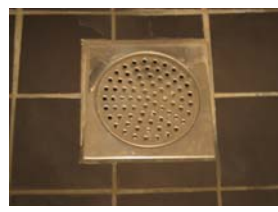
Placera tillbaka den lilla skopan och lägg på det rostfria gallret – så är det klart.