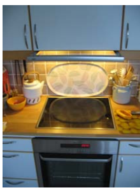
Vid placering av ugn under spishäll: Sätt igång fläkten för att hindra osen från ugnen att nå rökdetektorn

Kraftigt os från ugnen aktiverar lätt rökdetektorn i brandlarmet. För att hindra utlösning av larmet kan en medhjälpare vifta med kökshandduken vid rökdetektorn, allt för att skingra osen. Ett annat sätt är att ha igång spisfläkten eller hindra rökens spridning genom att öppna en skåpslucka över ugnen.