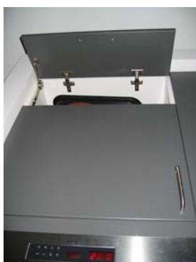
Vid placering av ugn i högskåp: Öppna översta skåpsluckan för att hindra osen från ugnen att nå rökdetektorn