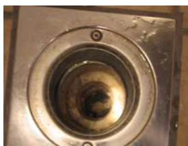
Så är det dags att ta bort duschrester.