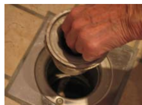
Stoppa ner armen, ta tag i metallbygeln och dra till ordentligt för att få upp låset.