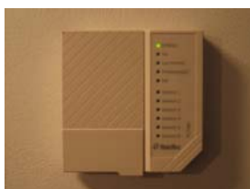
Öppna locket så når du knappsatsen

Säkerställ att du känner till den fyrsiffriga koden till larmet, att du har fått kännedom om den av den tidigare ägaren till lägenheten. På insidan av locket till larmenheten finns instruktioner för de vanligaste felen / justeringarna. Läs mer om larmet i lägenhetspärmen under flik 13.