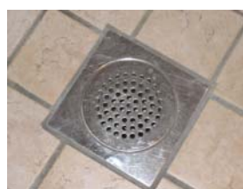
Lägg tillbaka det rostfria gallret och skruva fast det igen.