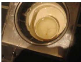
Så är det dags att ta bort duschrester.